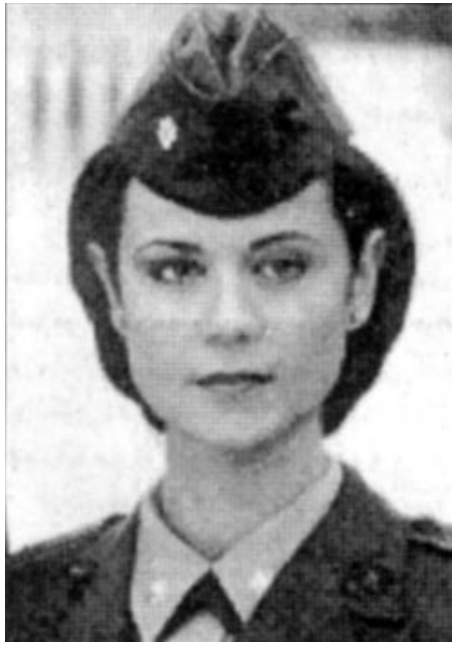
«کترین بل» ستاره سریال تلویزیونی «جگ»

مینا عزتی، مادر کترین بل، افزود: «کترین نان سنگک، کباب، برنج و ماست و خیار را بسیار دوست دارد.»